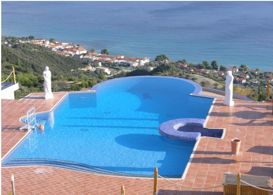
After / Fertiggestellt